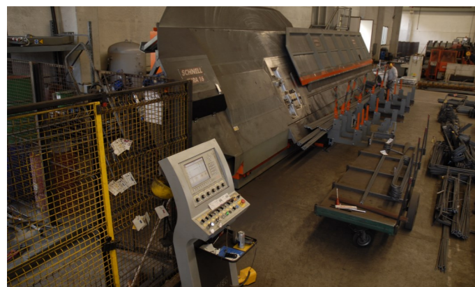
Eura 16 (anno 2011): rotolo da Ø 12 a Ø 16 mm doppia piega. Eura 16 (Jahrgang 2011): Ringmaterial von Ø 12 bis Ø 16 mm Doppelfalte. Eura 16 (année 2011) : bobine de Ø 12 à Ø 16 mm double pli.