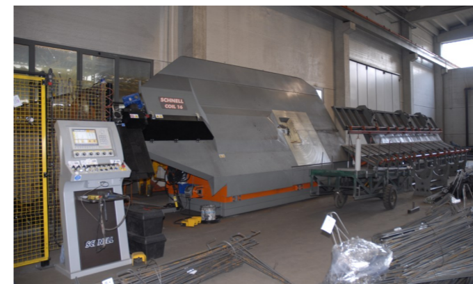
Coil 16 HS (anno 2011): rotolo da Ø 10 a Ø 16 mm. Coil 16 HS (Jahrgang 2011): Ringmaterial von Ø 10 - Ø 16 mm. Coil 16 HS (année 2011) : barres de Ø 10 à Ø 16 mm.