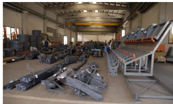
Produzione per diametro al fine di assicurare un servizio migliore. Produktion-Durchmesser um einen besseren Service zu gewährleisten. Production par diamètre pour assurer un meilleur service.