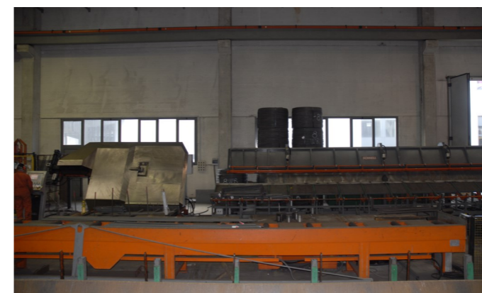
Formula 14 (anno 2009): rotolo da Ø 8 a Ø 14 mm. Formula 14 (Jahrgang 2009): Rolle von Ø 8 - Ø 14 mm. Formula 14 (année 2009) : bobine de de Ø 10 à Ø 14 mm.