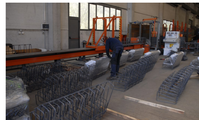
Produzione di elementi pre-assemblati. Produktion Elementen Vorzusammengebaute. Production d'éléments pré-assemblés.