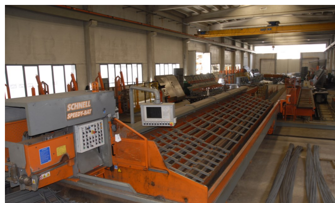
Speedy Bat (anno 2010): barre da Ø 10 a Ø 40 mm. Speedy Bat (Jahrgang 2010): Stäbe von Ø 10 - Ø 40 mm. Speedy Bat (année 2010) : barres de Ø 10 à Ø 40 mm.