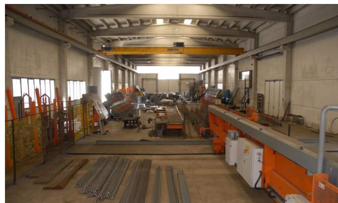
Stabilimento di 2'200 m2 con macchinari Schnell Spa. Werk von 2'200 m2 mit Schnell Spa Maschinen. Usine de 2'200 m2 avec machines Schnell Spa.