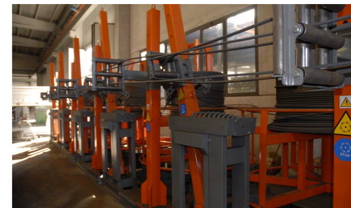
Coil 16 HS (anno 2011): trascinamento rotolo fino a 3m/s. Coil 16 HS (Jahrgang 2011): Ringmaterialnachschieben bis 3M/S. Coil 16 HS (année 2011) : entraînement bobine jusqu'à 3m/s.