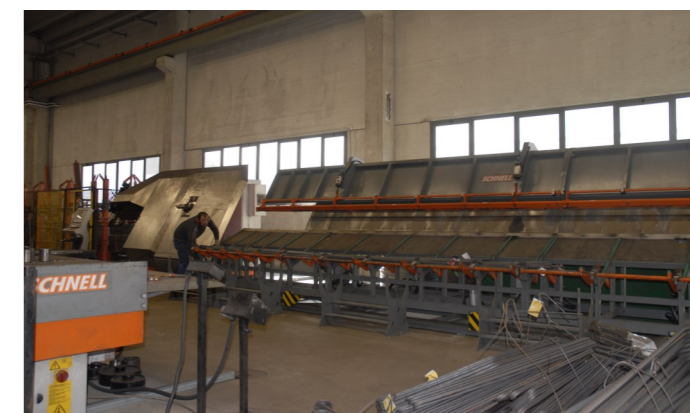
Formula 14 (anno 2009): rack di raccolta a 3 piste. Formula 14 (Jahrgang 2009): 3-Spuren Rack für die Sammlung. Formula 14 (année 2009) : rack de collecte à 3 pistes.