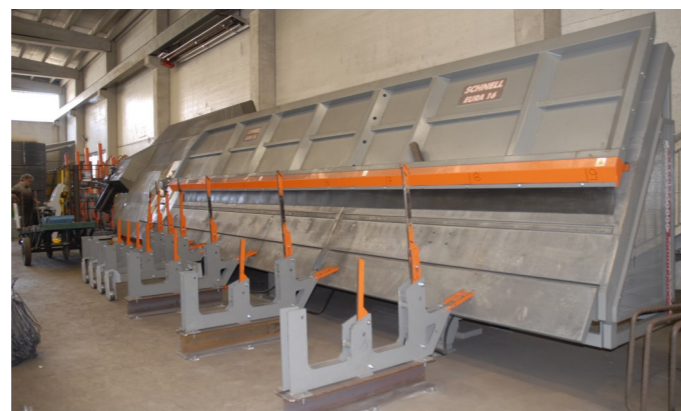
Eura 16 (anno 2011): rack di raccolta a 3 piste. Eura 16 (Jahrgang 2011): 3-Spuren Rack für die Sammlung. Eura 16 (année 2011) : rack de collecte à 3 pistes.