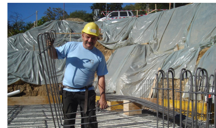
Maggiori vantaggi ed efficienza in cantiere. Mehr Vorteile und Leistungsfähigkeit auf der Baustelle. Plus d'avantages et d'efficacité sur le chantier.